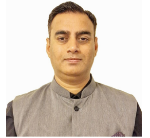
ROHIT VADHWANA EXCELENTÍSIMO EMBAJADOR DE INDIA EN BOLIVIA

Assumí el cargo de primer Embajador Residente de India en Bolivia el 19 de marzo de 2025 y presenté mis credenciales el 26 de mayo. En este año, hemos mantenido una colaboración bilateral sólida, visitas de alto nivel, firma de acuerdos, actividades comerciales y el establecimiento de vínculos a través de actividades culturales. Lo más importante: inauguramos una nueva Embajada en La Paz.